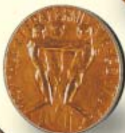
De la Paz