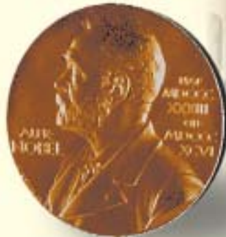
De Física y Química