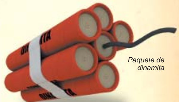
Paquete de dinamita

Trabajó con su padre en la aplicación de la nitroglicerina líquida a usos industriales, con la dificultad de ese producto, lo que provocó una explosión en el laboratorio que produjo la muerte de su hermano menor Emil. Inventó el detonador de fulminato de mercurio para cargas de nitroglicerina, material del que mejoró la seguridad en el transporte y la eficacia explosiva.