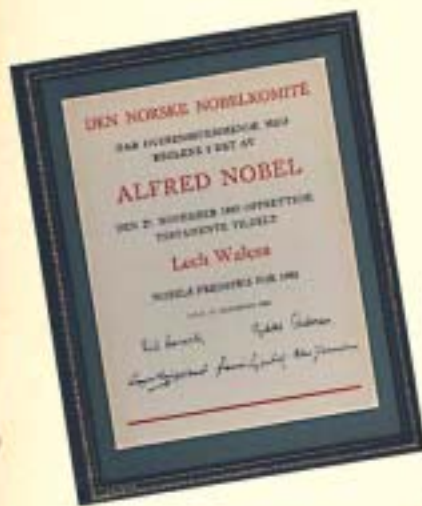
Diploma del premio Nobel de la Paz otorgado a Lech Walesa

Literatura (por la Academia sueca), Física, Química, y Economía (que se creó posteriormente y entregado por la Real Academia de Ciencias de Estocolmo).