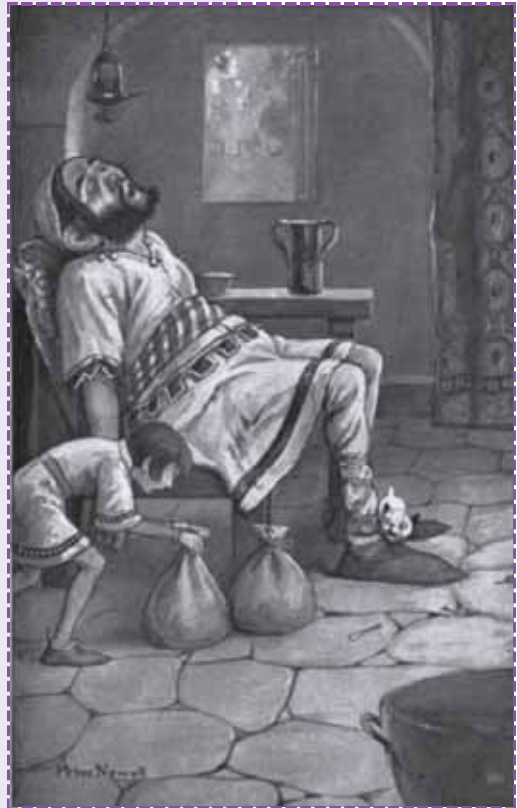
Ilustración de Newell, Peter. Favorite Fairy Tales: The Childhood Choice of Representative Men and Women . New York: Harper & Brothers, 1907.

¡Hay, dichosa de mí, que hijo tan listo tengo!