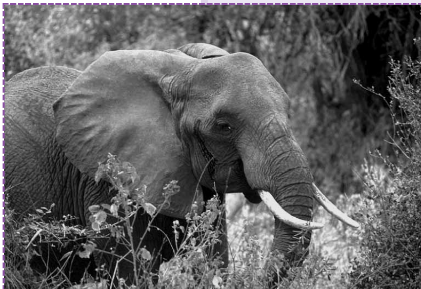
Imagen: Elefante Africano.

Tienen una única cría, que se desarrolla durante 22 meses dentro del cuerpo materno. Son mamíferos. Al nacer pesan alrededor de 115 kilogramos.