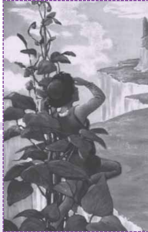
Ilustración de Jessie Willcox Smith. 1916. Swift's Premium Calendar.