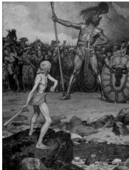
Imagen: Osmar Schindler, David und Goliat.